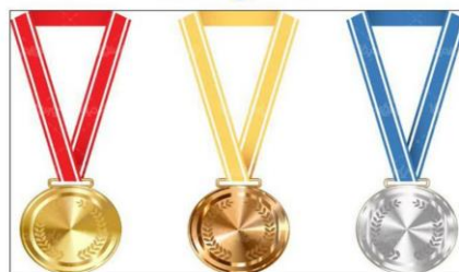
آموزشکده الزهرا (س) مشهد